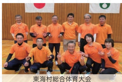
東海村総合体育大会