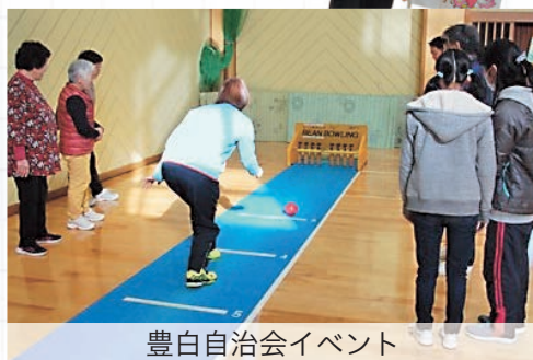
豊白自治会イベント