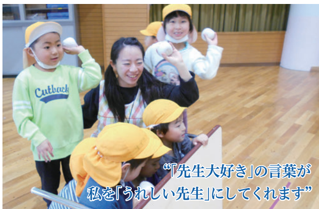
“「先生大好き」の言葉が私を「うれしい先生」にしてくれます”

私は子どもが大好きです。保育士は子どものことが大好きなだけで、できない仕事ですが、大好きでなければできない仕事だと思います。実際に好きなことを仕事にできる人はほんのわずかだと思いますが、私は幸運にも好きな仕事に就くことができました。学生時代に保育の実習先で出会った子どもたちから、すてきな言葉のプレゼントをもらいました。「うれしい先生になってね」と。その日から、私も子どもたちと一緒に過ごせることがうれしいと思える先生”でいるため、自身が楽しむことと笑顔でいることを大事にしています。