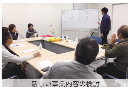
新しい事業内容の検討