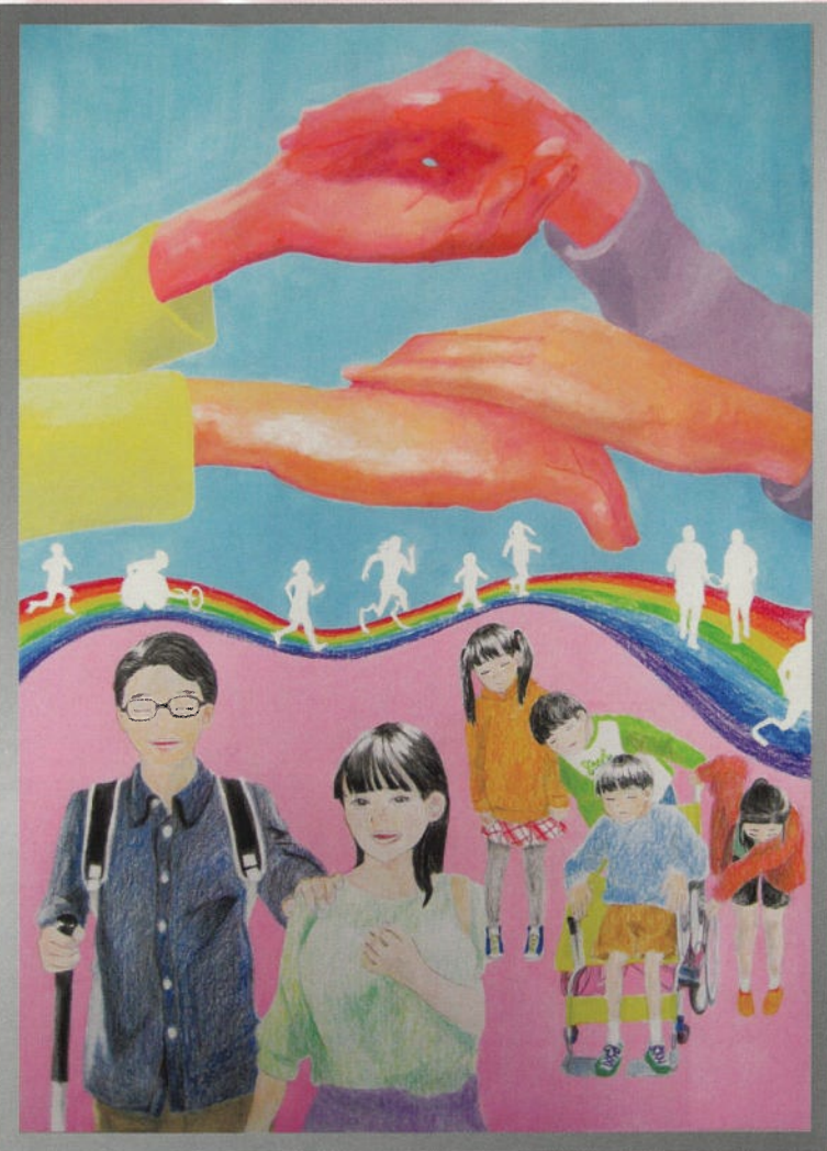
令和4年度障害者週間ポスター（中学生の部）茨城県知事賞最優秀賞