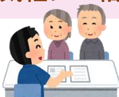
主任ケアマネジャー