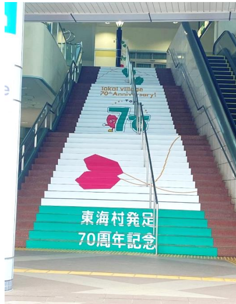
【東海駅階段サイン(西口)】