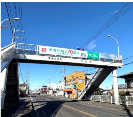
【横断幕(東海中学校前)】

のぼり旗については、希望のあった村内事業所に、所直接届けに回った。「わざわざありがとね！さっそく飾るね。」などとねぎらいの言葉をかけていただいたり、「70周年記念PRしていくよ。」と、共に70周年を盛り上げていただけるような言葉をいただいたりした。