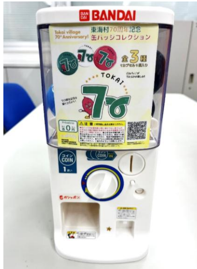
【缶バッジガシャポン】