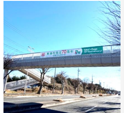
【横断幕(すこやかハウス前)】