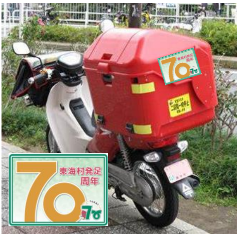
【郵便バイク貼付ステッカー】