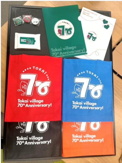
【ノベルティグッズ】