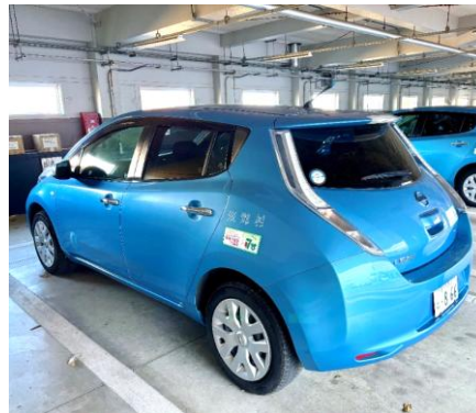
(リーフ側面ドアに磁石が付かず焦る)