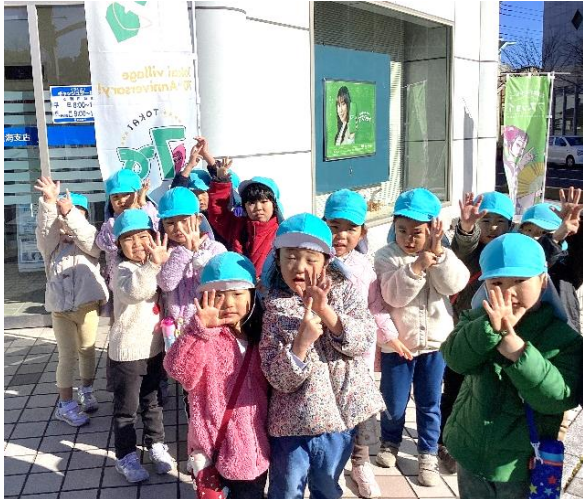
見つけたのぼりの本数を指で示す子どもたち