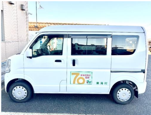
【公用車マグネット】