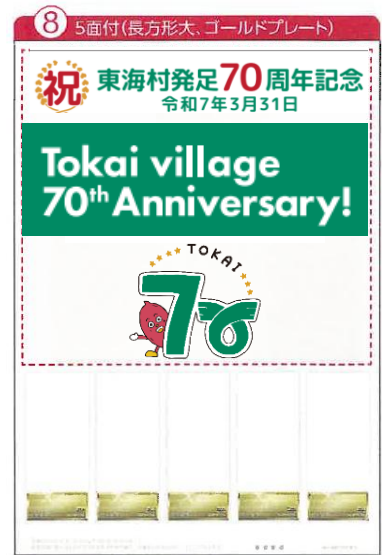
【記念切手】※6月後半より販売