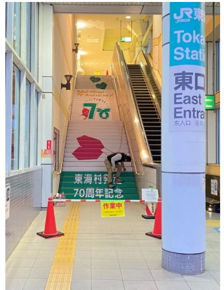
【東海駅階段サイン(東口)】