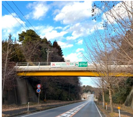
【横断幕(いちょう通り)】