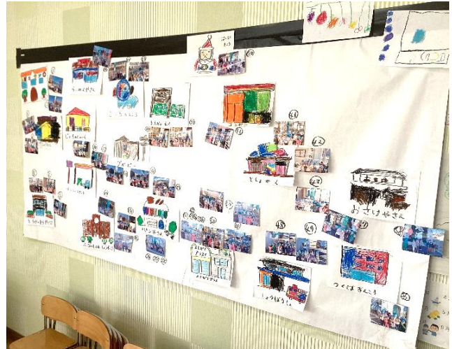
のぼりのあった場所を示す地図作り