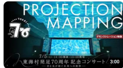
東海村発足70周年記念コンサートプロジェクションマッピングデモンストレーション... :