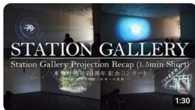
Station Gallery Projection Recap(1.5min short) :

今回のステーションギャラリーでの上映を見逃してしまった方や、もう一度楽しみたい方など、下記のQRコードをクリックして、美しい映像を堪能していただきたい。