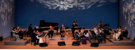
N響団友ポップスオーケストラ(16名編成)