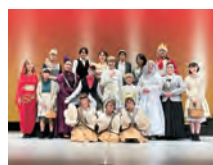
【昨年度の公演の様子】

劇団とみかる tomicaloffice@gmail.com 、東海文化センター(☎282局8511)