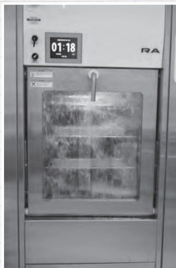
▲自動超音波洗浄装置