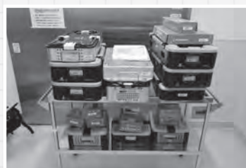
▲手術の内容に合わせた洗浄・消毒・滅菌済み器材のセット組み

今後は、現在の職員の中で滅菌技師を増やせるような体制を整備し、さらなる安全・安心な医療の提供に大きく貢献していきたいと思えます。