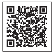
▲スマホクリエイターズLab.

「スマホクリエイターズLab.」は、村と住民が一緒になって地域を面白くする取り組み「東海村つながるプロジェクト(T-project)」から生まれた企画です。プロの講師から撮影技術や記事の書き方、SNS等を活用した情報発信スキルを学んだ住民ライターが、まちづくりに参加し、村の魅力を発信しています。