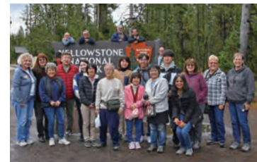
イエローストーン国立公園