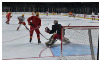
MACで地元アイスホッケーチームの練習を見学