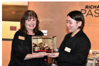
歓迎会での記念品交換