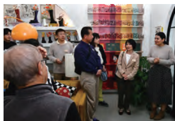
自然派リップ製造・販売「poppy & pout」見学