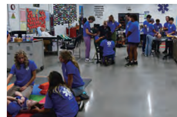
キャリア&テクニカル教育センターの授業