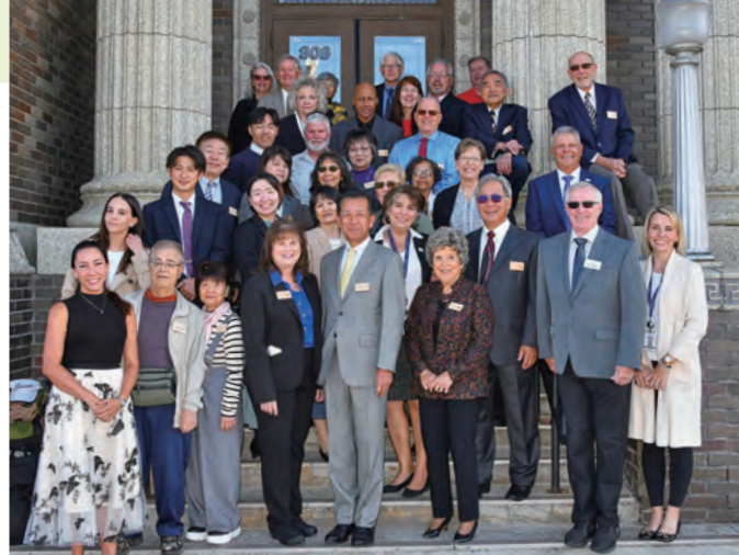
市長・議会表敬訪問

【問い合わせ】東海村姉妹都市交流協議会事務局(政策推進課内 ☎282-1711 内線1304)