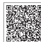
▲学区の確認はこちら

稚園または認定こども園となります。 ▼とうかい村松宿こども園と石神幼稚園については、対象学区からの申し込み空きがあった場合のみ、対象学区外からの申し込みを受け付けます。