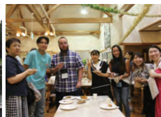
ようこそ東海村へ！