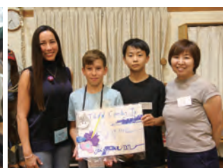
ホストファミリーと対面