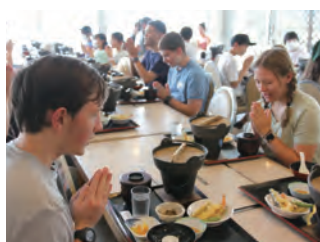
山梨名物「ほうとう鍋」