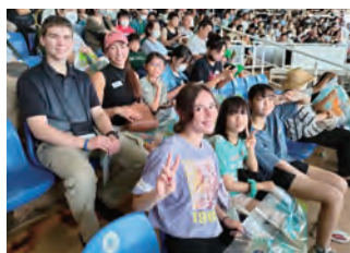
アクアワールド茨城県大洗水族館