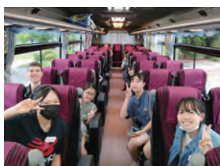
バスでのひととき