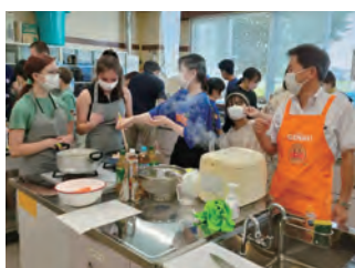
カレーライス作り