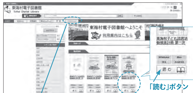
▲東海村電子図書館トップページ(イメージ)

【「予約する」ボタンをクリックすると…】 他の人が借りている電子書籍は「予約する」ボタンが表示されます。「予約する」ボタンをクリックすると、1人につき2点まで予約できます(取り置き期間は1週間)。