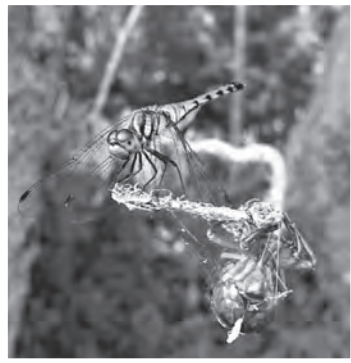
【枝先に止まるアキアカネ】

翅の先端に黒い模様をもつ赤とんぼは数種類ありますが、村内ではノシメトンボが多く見られます。水辺の枝先などに止まって縄張りをつくり、餌となる小さな昆虫を捕食したり、近づいてきた他の個体