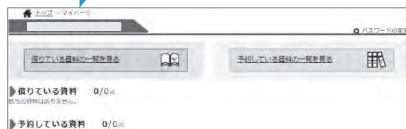
▲マイページ(イメージ)