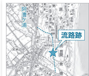
【図2 確認された流路跡(星印)】(点線は郷土学習資料に描かれる上の川のルート)

以前に阿漕ヶ浦が海とつながっていた」という話は地域に伝わっていたようで、郷土学習資料の中にも上川が書き込まれた図を見ることができ(図1参照)。