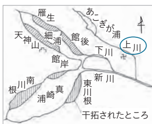
【図1 真崎浦・細浦西野開墾地域図】(昭和59年改訂「のびゆく東海」掲載図に筆者加筆)

しかし、阿漕ヶ浦の水位は海拔15メートルで海面より高いことから、「東海村の自然誌」(平成19年発行)では、江戸時代ごろに「阿漕ヶ浦が汽水湖だった」と報告して「海とつながっていた」とする説は科学的にも立証できない」と報告しています。やはり、古者が伝える