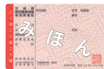
国民健康保険 被保険者証

マイナンバーカードを保険証として利用するには、マイナポータルサイト( https://myna.go.jp )での事前登録が必要です。※▽運用開始後も従来の保険証を利用できます。▽医療機関や薬局によって運用開始時期が異なりますので、ご注意ください。