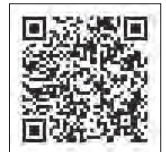
※2 マイナポイント事業ホームページ