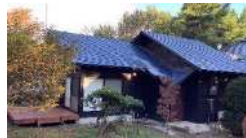
ワーケーション可能な農泊施設（イメージ）

中山間地域の基幹産業である農林漁業の「仕事づくり」を軸として、豊かな自然、魅力ある多彩な地域資源・文化等やデジタル技術の活用により、活性化を図る地域づくりを目指す。