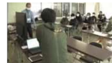
データを活用したスマート農業の取組 （高知大学）

地域産業・若者雇用の創出や、地元企業や地方公共団体と連携した地方大学の取組を促し、大学を核として地方活性化が図られるような地域づくりを目指す。