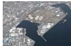
太陽光発電と大型蓄電池によるマイクログリッド （静岡県静岡市）

2030年度までに民生部門の電力消費に伴うCO 2 排出実質ゼロを実現するにあたり、デジタル技術も活用して脱炭素化に取り組み、地域課題の解決につなげる地域づくりを目指す。