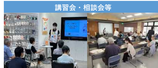
令和3年度デジタル活用支援推進事業（総務省）における講習会等の様子