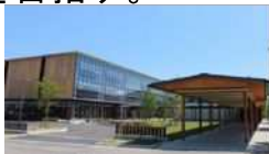
スマートシティAiCT（福島県会津若松市）

中山間地域の基幹産業である農林漁業の「仕事づくり」を軸として、豊かな自然、魅力ある多彩な地域資源・文化等やデジタル技術の活用により、活性化を図る地域づくりを目指す。