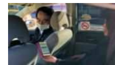
MaaSアプリを利用したタクシー配車 （群馬県前橋市）

地域住民等の移動ニーズに対応して、複数の公共交通やそれ以外の移動サービスを組み合わせる検索・予約・決済等を一括して行うMaaSを実装し、移動の利便性向上等が図られたまちづくりを目指す。