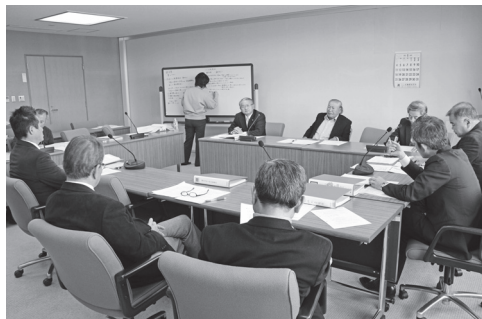
活発に協議する議会活性化特別委員会

予算審議は平成27年3月議会から新たな常任委員会での通年審議に、委員会の傍聴は平成26年12月19日から原則公開になりました。