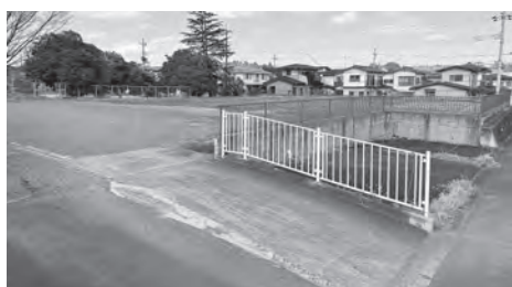
須和間地内の村有地（南台保育所跡地）

供する事業者を公募したが、応募に至っていない。 問 介護施設誘致のために、村有地のさらなる開放や土地利用条件の部分的な拡大が必要と考えるが見解は。 答 介護施設誘致のために村有地を提供するなどの土地利用計画は現在のところないが、村民に必要なサービスが適切に整備されるよう、地域ニーズを的確に把握するとともに、引き続き事業者参入の動向を見守る。