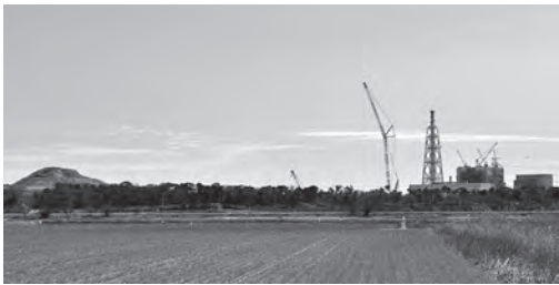
最近の東海第二原発（2026年3月撮影）