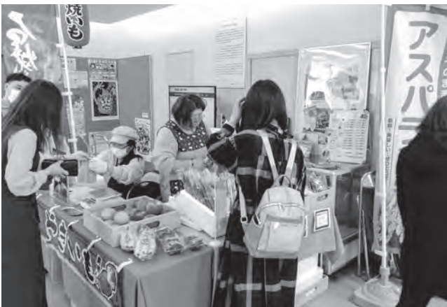
役場庁舎1階で行われる障がい福祉事業所による物品販売