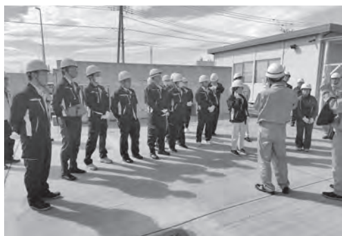
鋼製防護壁基礎部モックアップ施設で説明を受ける様子

実規模で行われている鉄筋組立試験やコンクリート充填性確認試験の様子を見学しました。また、緊急時対策所建屋の建屋内部や屋上階から安全性向上対策工事の進捗状況を確認しました。今後も、村内の原子力施設について継続的に視察を実施していく予定です。