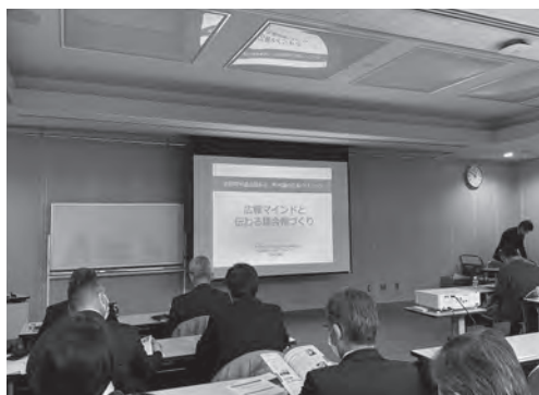
町村議会広報クリニックの様子

当日は、編集に関する技術的な手法を学ぶとともに、本村の議会だよりについて直接アドバイスをいただくことができました。今回のクリニックで得た知見を生かし、今後も皆さまに議会での審議内容や村政の課題をより分かりやすくお伝えできるよう、議会だよりの作成に努めていきます。