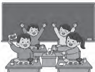
小学6年生と中学3年生が選んだ人気メニューが提供される給食総選挙

問 4月から小学校の給食費はどうなるか。 答 令和8年4月より、国・県から小学生1人当たり月額5200円が交付される。本村の実際の給食費は月額約5900円のため、差額の約700円は引き続き村が負担し、保護者の負担が生じないよう対応する。食物アレルギー等で給食を食べられない児童の保護者に対しても、補助金交付等の負担軽減策を検討している。 問 給食の質は下がらないか、物価高騰時の対応は。 答 保護者負担の軽減