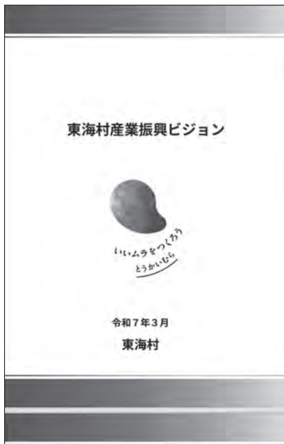
村ホームページで公開されている 東海村産業振興ビジョン

問 東海村産業振興ビジョンは付加価値額の約7割を占める専門・科学技術、業務支援サービス業、電気業を基軸とし、関連産業を中心に推進する内容となっている。本ビジョン策定の手続きは。