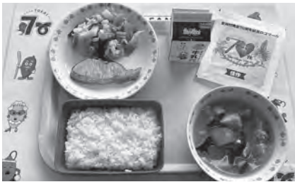
学校で提供された給食

る。また、学校給食費には、精米代・牛乳代の一部等の支援をしている。現在の中学校給食費は、1人当たり月額約5900円であることから、差額の1300円を村が負担している。年額では1人当たり14300円の支援をしている。この差額分を村が負担することで、保護者の負担軽減を図っている。今後は国の方針に合わせて、無償化を実施していきたい。