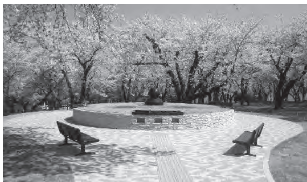
合葬式墓地のイメージ

問 合葬式墓地の供用開始時期や運用方法などについて、担当課にも住民からの問い合わせが寄せられている状況である。自治会長連絡会議や民生委員・児童委員協議会の定例会などの場を活用した周知は、情報を広く、直接お届けする上で、非常に効果があると認識しており、適切な時期に設ける方向で検討していく。