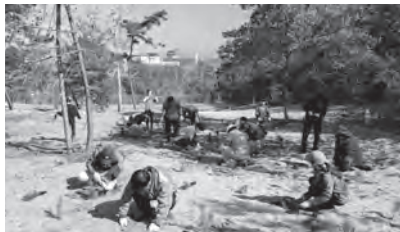
村松海岸の松林を守るためにスーパーエリートの高抵抗性クロマツ苗を植樹

問 村松海岸で松くい虫によるマツ枯れが広がっている。千々乱風伝説の砂嵐を防ぐためにも村松海岸の松林を守ることは大切。被害は海岸松林の何割程度に広がっているか。被害拡大防止のためにこれまで投入した費用とその対応は。 答 平成24年頃から被害が拡大し、現在は全体の5〜6割程度に広がっている。被害拡大防止と松林再生のために平成28年度からの10年間で約6000万円投入し、薬剤散布や枯れ木の伐倒およびくん蒸処理等