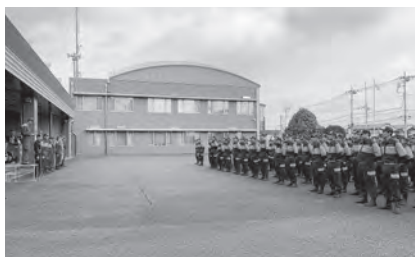
毎年開催されている消防団夏季訓練

今後、意見集約後に円滑な再編を進める。 問 人口動態や地理的条件など、客観的データに基づく検討は。 答 重要な視点であり、今後の研究課題の一つとする。