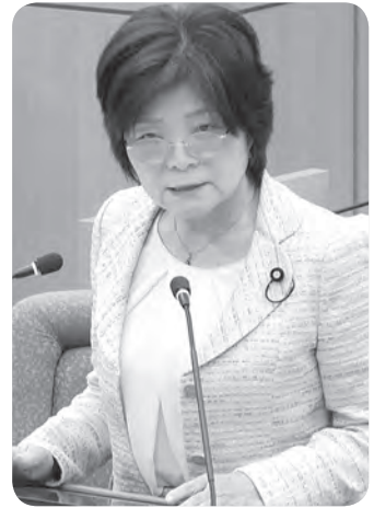
光風会 恵利 いつ 議員

問 村松海岸で松くい虫によるマツ枯れが広がっている。千々乱風伝説の砂嵐を防ぐためにも村松海岸の松林を守ることは大切。被害は海岸松林の何割程度に広がっているか。被害拡大防止のためにこれまで投入した費用とその対応は。 答 平成24年頃から被害が拡大し、現在は全体の5〜6割程度に広がっている。被害拡大防止と松林再生のために平成28年度からの10年間で約6000万円投入し、薬剤散布や枯れ木の伐倒およびくん蒸処理等