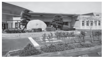
要支援者の避難所の一つである総合福祉センター「絆」

問 原子力災害時、在宅介護の人へのヘルパーの支援は。 答 支援者自身の安全確保が最優先で、ヘルパーの支援は通常のサービスタスクの範囲外。避難行動要支援者として登録いただきたい。 問 社会はエイブリズム（健常者中心主義）の克服が必要だ。 答 本村の高齢の独り暮らし1368世帯。自宅での介護者972名。障がい者1672名（重複あり）。原則この全てを避難行動要支援者登録し、要介護者も登録基準の見直しを。しかし登録は今年1月