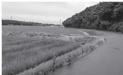
季節の風を感じる細浦の村道

問 物理的な歩道整備が困難な場所において、歩行者の安全を確保するための具体的な整備方針と村民が歩きたくなる動機づけや健康寿命延伸に向けた村の考えを具体的に伺う。 答 生活道路は歩道整備が困難な路線が多いため、デジタル技術の活用について調査・研究する。ウォーキングの継続は環境要因が大きく左右するため、新しいルート整備や他のイベントとの連携を図りながら、運動習慣の定着に向けて取り組んでいく。