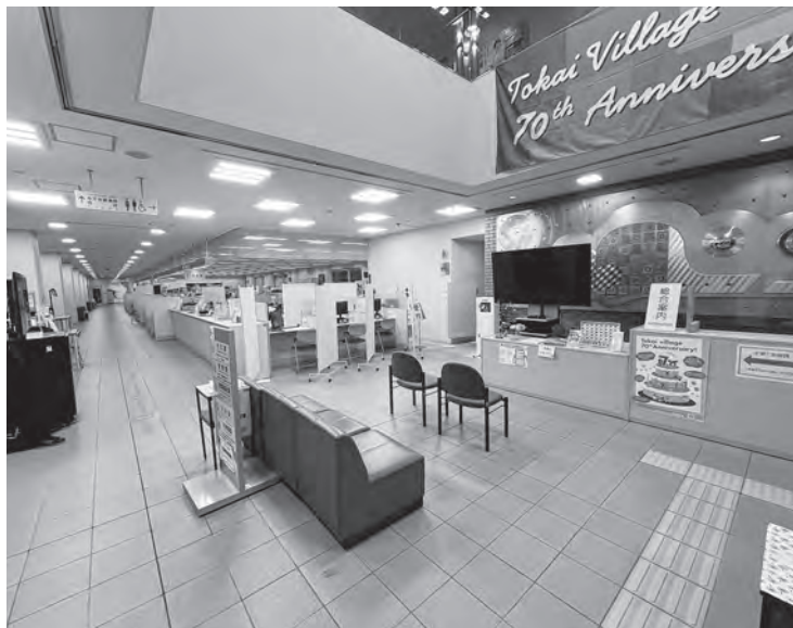
改修が予定される村役場庁舎 1 階窓口