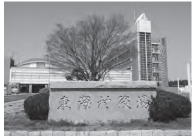
村民1人当たり6,000円の現金支給を実施する東海村役場

問 村の物価高対策で、国の交付金を活用した「6千円の現金給付」について、財力があるにもかかわらず、他自治体より見劣りする内容である。国交付金は、財政力によって減額される仕組みだが、減額部分を独自財源で補填し、より手厚く実施すべきではなかったか。 答 総事業費2億5千万円のうち、4千4百万円を村の一般財源から充当する。国交付金は、財政力指数の高い本村では交付額が抑えられているが、限られた財