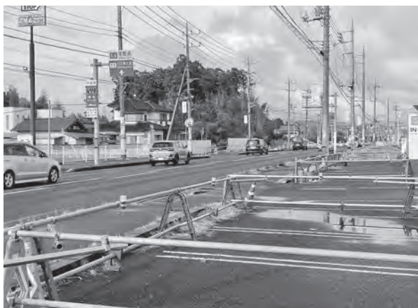
4車線化が行われる国道6号

答 導入には土地条件や区域バランスの整理が必要であり、今後石神地区活性化の取り組みの中で検討を進める。