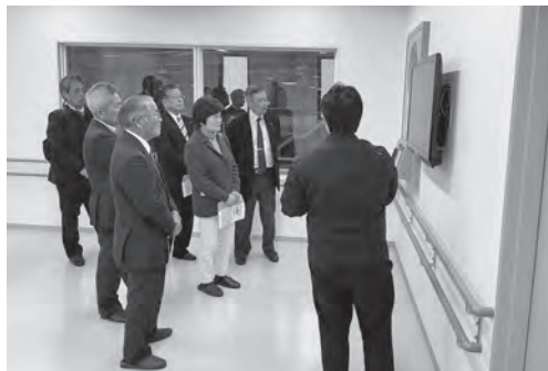
ひたちなか・東海クリーンセンターの施設内を見学する委員

総務委員会ではひたちなか地区の調査視察を目的として、1月28日にひたちなか・東海クリーンセンターを視察しました。施設の概要説明を受け、その後、プラットホームやごみピット、灰溶融炉など主要設備を見学し、ごみ処理の流れを確認しました。焼却炉で発生した熱を利用した発電により施設内の電力を賄う仕組みや、処理後に発生する灰を資源として再利用する取り組みなど、環境負荷を抑えたりリサイクル型施設であることを実感しました。また、炉内に残った不燃物の展示を通して、施設を長期的に維持し、効率的な処理を行うためには、村民一人一人の適切な分別が欠かせないことを改めて認識しました。