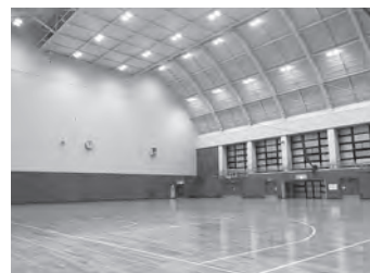
総合体育館 メインコート