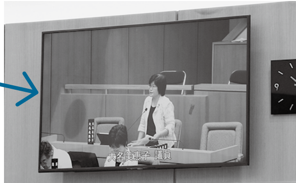
発言者の様子など、モニターで放送内容が見られる