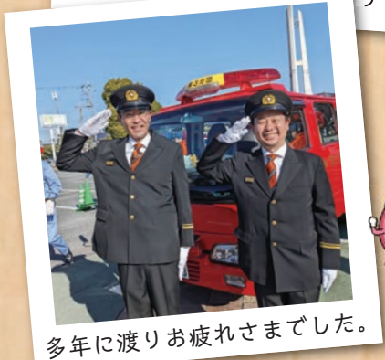
多年に渡りお疲れさまでした。