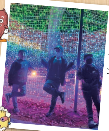
子どもたちの未来を照らすイルミネーション