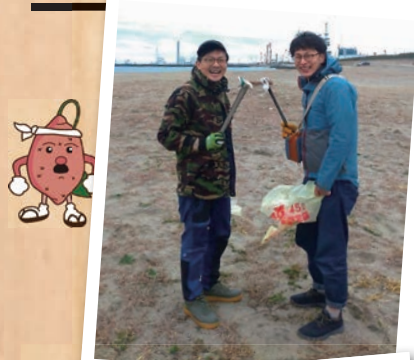
東海村らしい風景を残してこのころ

※日程は変更になる場合があります。 ※開会・一般質問・議案審議は、議会棟2階の議会事務局窓口で住所・氏名等を記載するだけで、どなたでも傍聴できます。