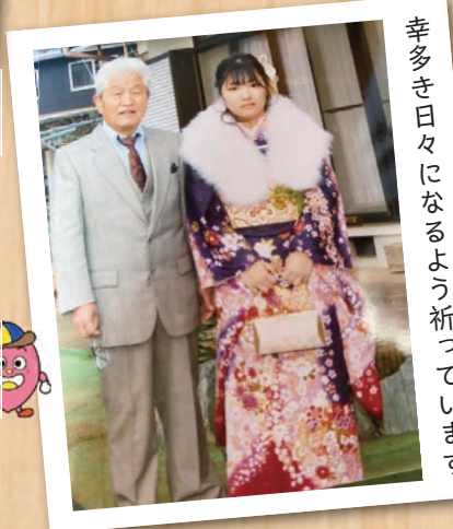
幸多き日々になるよう祈っています