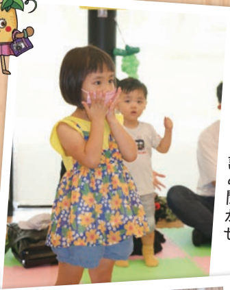
高校生会による読み聞かせ