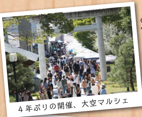
4年ぶりの開催、大空マルシェ

※開会・一般質問・議案審議は、議会棟2階の議会事務局窓口で住所・氏名等を記載するだけで、どなたでも傍聴できます。