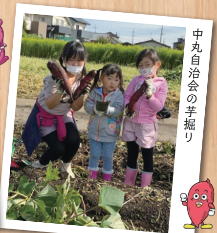
中丸自治会の芋掘り