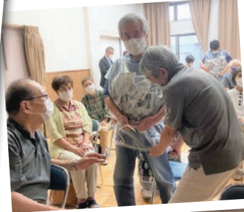
即席のダウンジャケット作りました