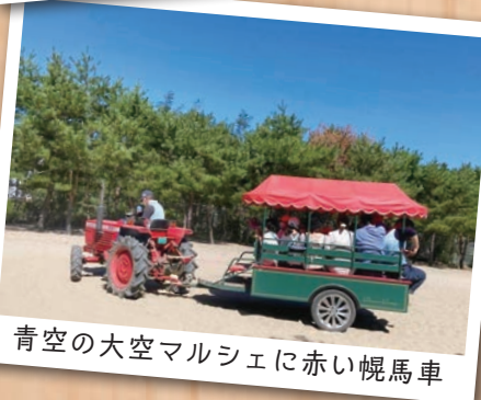
青空の大空マルシェに赤い幌馬車