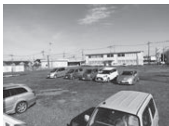
売却を視野に検討する旧役場跡地

答 古い名称の道路標識は部分的に更新してきたが、新たな道路や公園など、さまざまな施設も整備される予定。案内標識は観光や防災に資する重要な施設となるので現状の把握を始め、対策を進めたい。