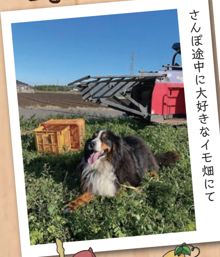
さんぽ途中に大好きなイモ畑にて