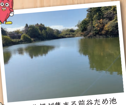
つり公望が集まる前谷ため池