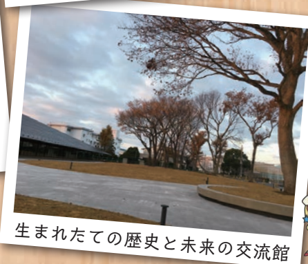
生まれたての歴史と未来の交流館