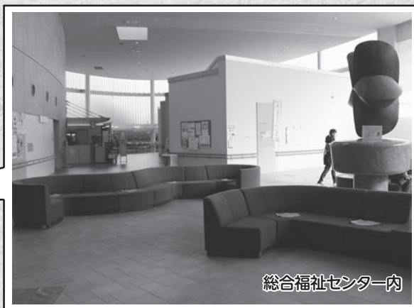
総合福祉センター内