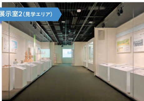
展示室2(見学エリア)