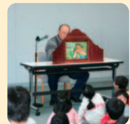
▲むかし話の会による紙芝居