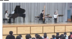
12月 中丸ふれあいコンサート