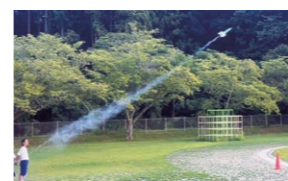
8月 ペットボトルロケットを作って飛ばそう！