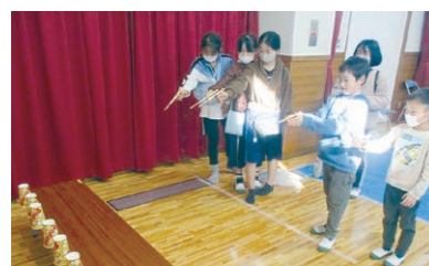
12月 今昔の遊び&いちりん祭