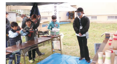
11月 三世代交流会事業