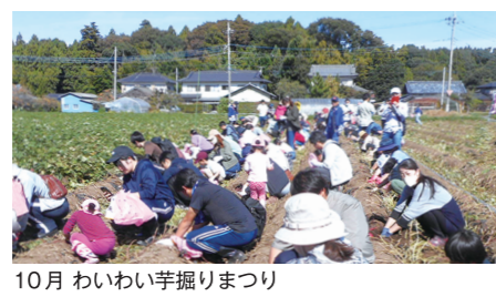
10月 わいわい芋掘りまつり