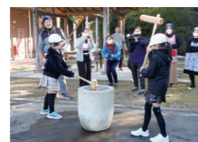
1月 まゆ玉づくり会