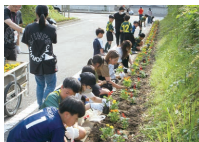
7月 地域の環境美化