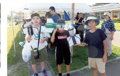
8月 ペットボトルロケットを作って飛ばそう！