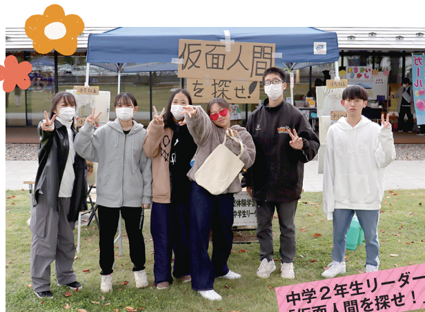
中学2年生リーダー会 「仮面人間を探せ!」

やったん祭は、中学生リーダーで話し合ってお出展することに決めました。やったん祭を運営してみて、一から計画を立てるの難しさや当日遊びに来てくれた子どもへの対応の仕方など、たくさん初めての経験がすることができました。貴重な経験をありがとうございました。