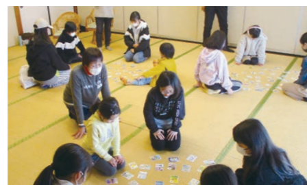
2月 ひなまつり特別企画