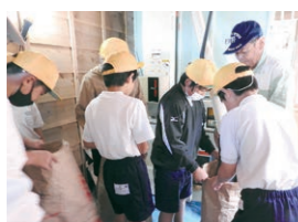
10月 もみ袋詰め体験