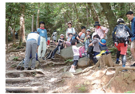
5月 親子ハイキング