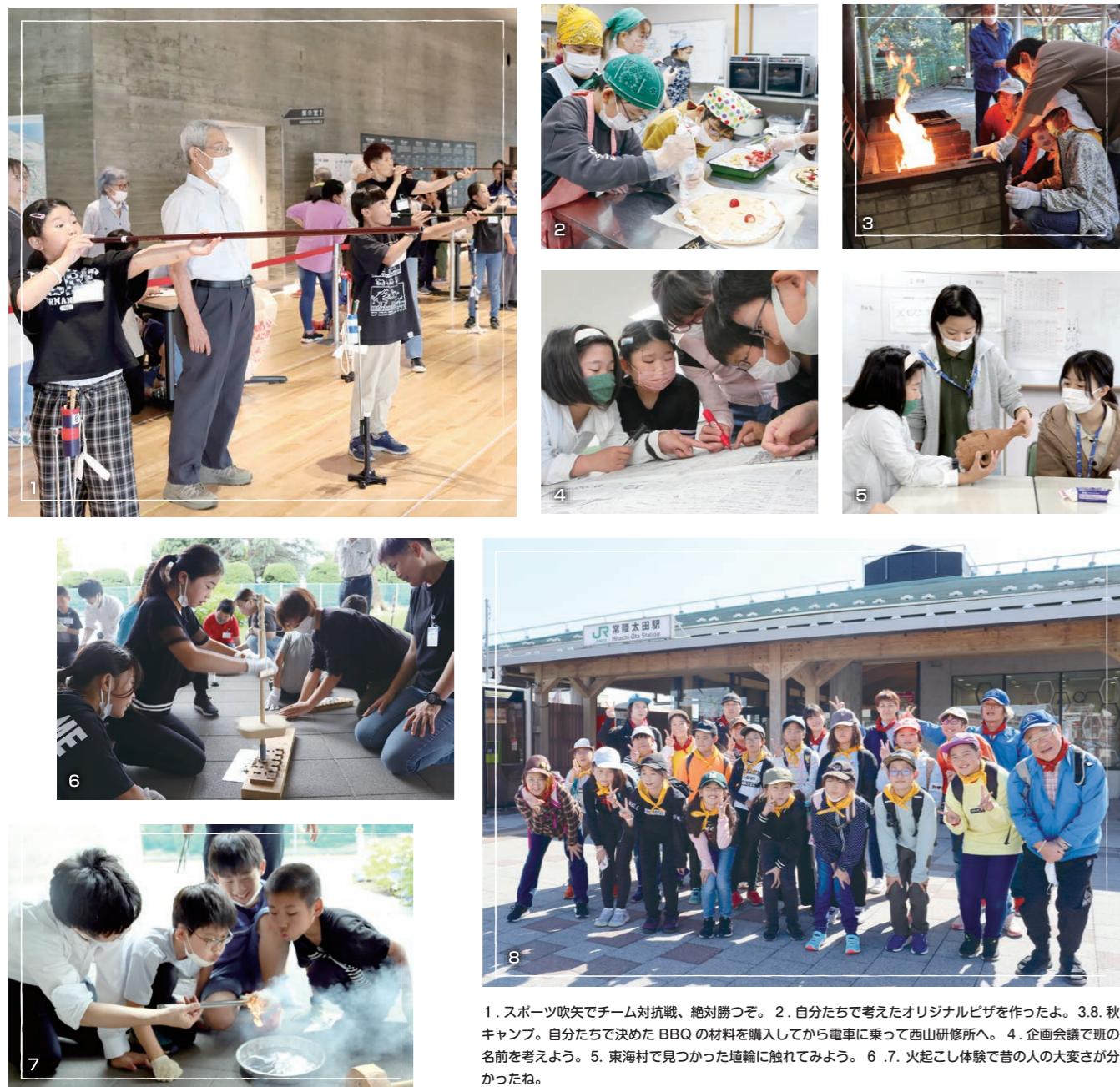
1. スポーツ吹矢でチーム対抗戦、絶対勝つぞ。2. 自分たちで考えたオリジナルピザを作ったよ。3.8. 秋キャンプ。自分たちで決めた BBQ の材料を購入してから電車に乗って西山研修所へ。4. 企画会議で班の名前を考えよう。5. 東海村で見つかった地輪に触れてみよう。6 .7. 火起こし体験で昔の人の大変さが分かったね。