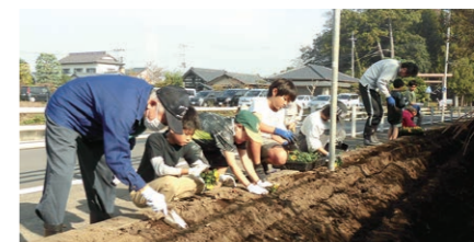
11月 第2回 石神地域ふれあい花壇整備