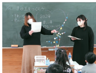
1月 まゆ玉づくり会