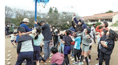
10月 秋季ふれあい運動会