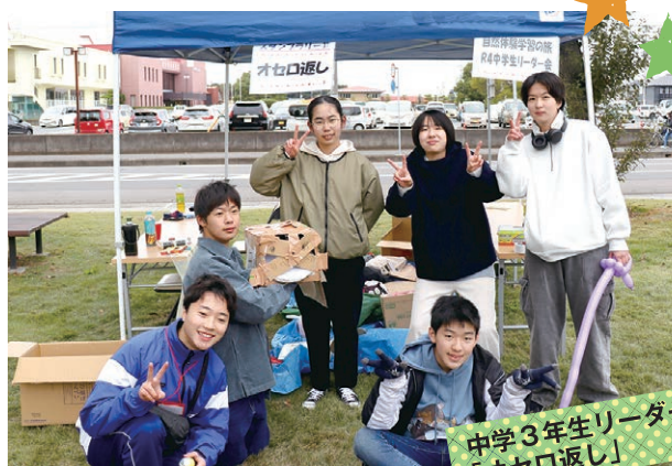
中学3年生リーダー会 「オセロ返し」