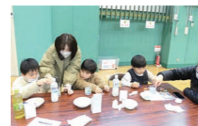
2月 キャンドル作り