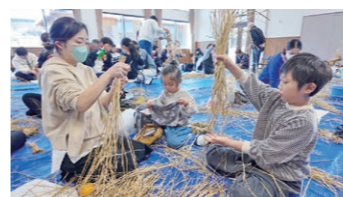
12月 しめ縄作りと餅つき