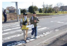
12月 ウォークラリー大会