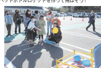
12月 お楽しみウォークラリー大会