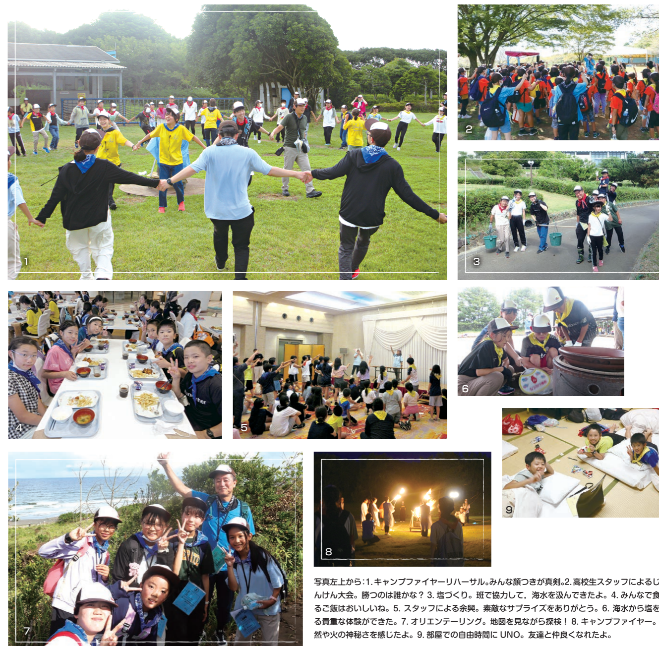
写真左上から:1. キャンプファイヤーリハーサル。みんな顔つきが真剣。2. 高校生スタッフによるじゃんけん大会。勝つのは誰かな? 3. 塩づくり。班で協力して、海水を汲んできたよ。4. みんなで食べるご飯はおいしいね。5. スタッフによる余興。素敵なサプライズをありがとう。6. 海水から塩を作る貴重な体験ができた。7. オリエンテーリング。地図を見ながら探検! 8. キャンプファイヤー。自然や火の神秘さを感じたよ。9. 部屋での自由時間に UNO。友達と仲良くなれたよ。