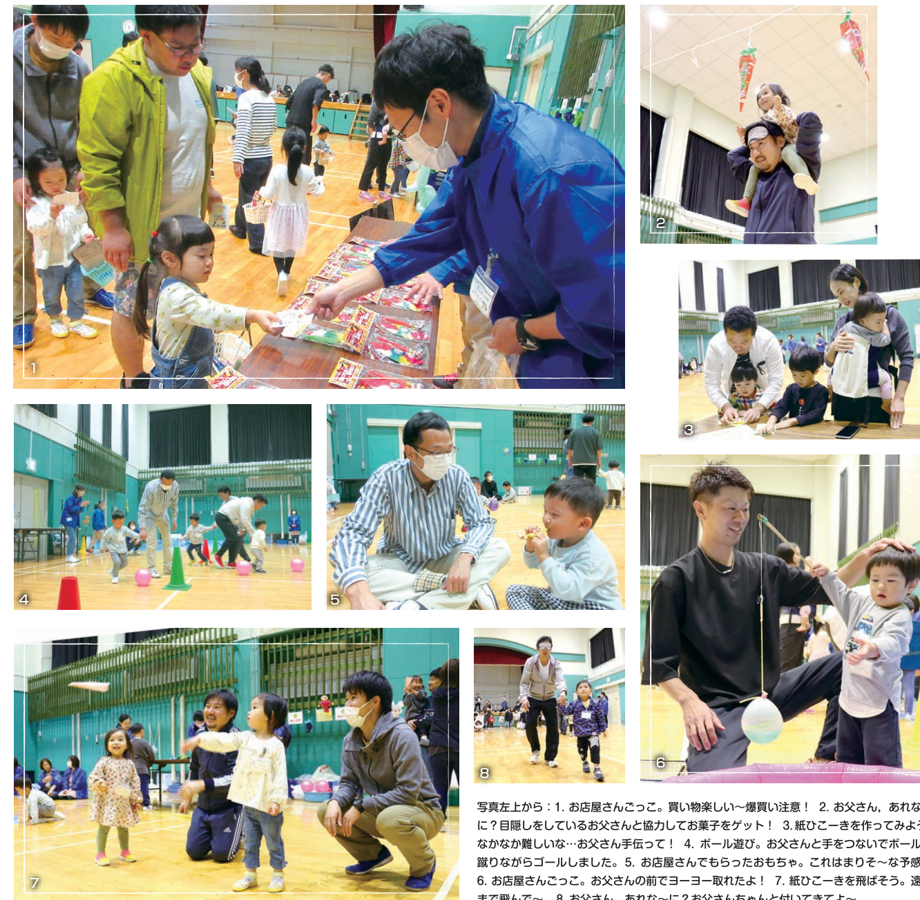
写真左上から：1. お店屋さんごっこ。買い物楽しい～爆買い注意！ 2. お父さん、あれなに？目隠しをしているお父さんと協力してお菓子をゲット！ 3. 紙ひこきを作ってみよう。なかなか難しいな～お父さん手伝って！ 4. ボール遊び。お父さんと手をつないでボールを蹴りながらゴールしました。5. お店屋さんでもらったおもちゃ。これはまりそ～な予感… 6. お店屋さんごっこ。お父さんの前でヨーヨー取れたよ！ 7. 紙ひこきを飛ばそう。遠くまで飛んで～。8. お父さん、あれなに？お父さんちゃんと付いてきてよ～。

ゲームなどを通して父子のふれあいの場を提供するとともに、集団の中で子どもがどのような行動・言動するかを確認し、今後の子育ての参考にもらうための事業です。