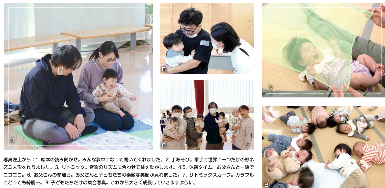
写真左上から：1. 絵本の読み聞かせ。みんな夢中になって聞いてくれました。2. 手あそび。軍手で世界に一つだけの野ネズミ人形を作りました。3. リトミック。音楽のリズムに合わせて体を動かします。4.5. 休憩タイム。お父さんと一緒にニコニコ。6. お父さんの参加日。お父さんと子どもたちの素敵な笑顔が見れました。7. リトミックスカーフ。カラフルでとっても綺麗～。8. 子どもたちだけの集合写真。これから大きく成長していきますように。