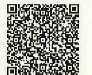
一覧表の最新情報はこちら