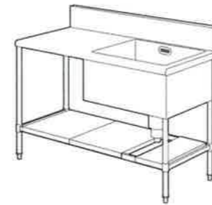
※写真は参考図です。