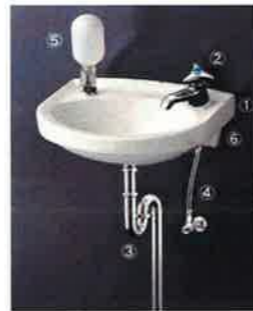
※参考図となります。