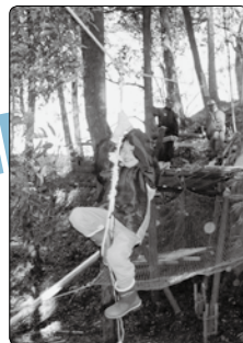
「ふるさと少年教室」