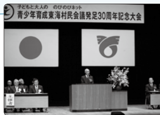
「発足30周年記念大会」