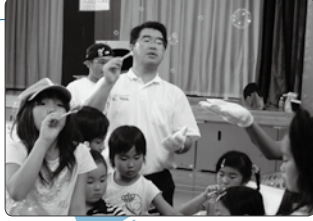
「三世代交流会」 / 石神支部