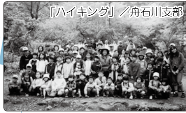
「ハイキング」 / 舟石川支部