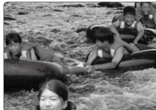
「友情の船 北海道研修の旅」