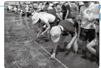
「田植え」 / 照沼支部