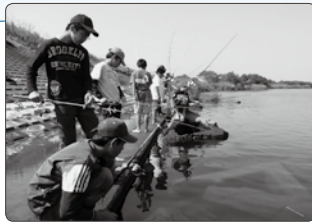
「ハゼ釣り大会」 / 白方支部