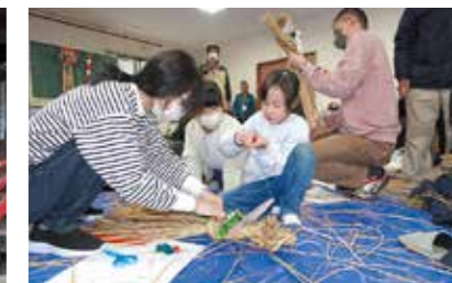
12月 しめ縄作りと餅つき