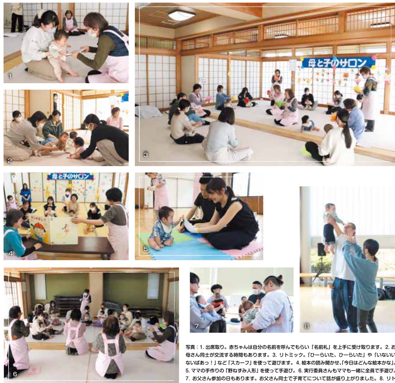
写真：1. 出席取り。赤ちゃんは自分の名前を呼んでもらい「名前札」を上手に受け取ります。2. お母さん同士が交流する時間もあります。3. リトミック。「ひーらいた、ひーらいた」や「いないいないばあっ！」など「スカーフ」を使って遊びます。4. 絵本の読み聞かせ、「今日はどんな絵本かな」。5. ママの手作りの「野ねずみ人形」を使って手遊び。6. 実行委員さんもママと一緒に全員で手遊び。7. お父さん参加の日もあります。お父さん同士で子育てについて話が盛り上がりました。8. リトミック。「クジラが塩吹いて、びゅー」お父さん高いね。

初めての子育てについての学習や絵本の読み聞かせ、手遊びなどのレクリエーションを楽しみながら、育児に関する情報交換や相談などが気軽にできる友達を作ってもらうための事業です。