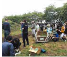
7月 花いっぱい運動