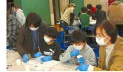
2月 ふれあい事業「化石のレプリカをつくろう!」