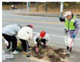
11月 環境美化花植え