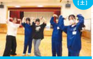
中学生リーダー・スタッフ合同研修