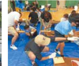
8月 「親子で木工教室」