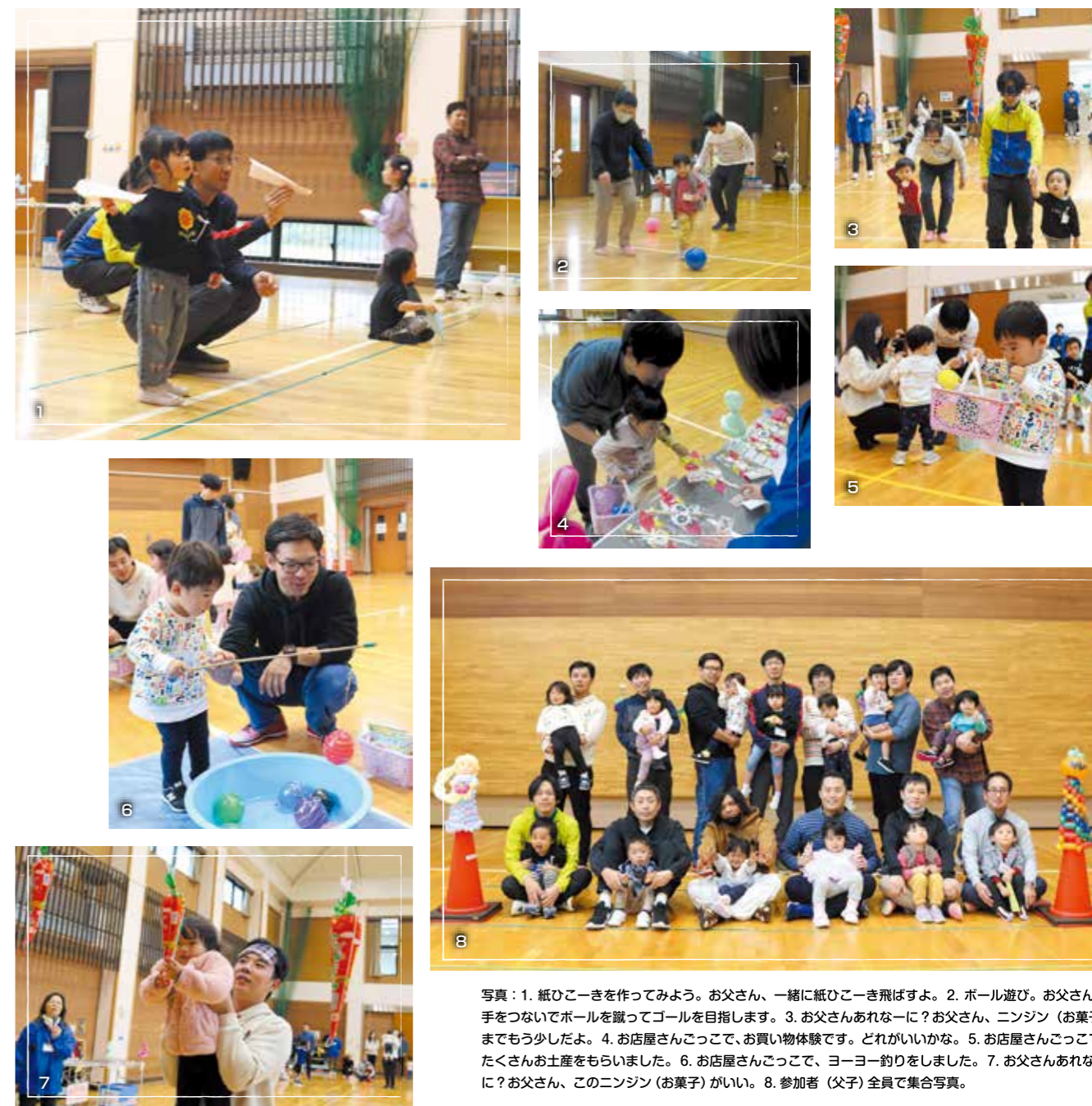
写真：1. 紙ひこきを作ってみよう。お父さん、一緒に紙ひこき飛ばすよ。2. ボール遊び。お父さんと手をつないでボールを蹴ってゴールを目指します。3. お父さんあれなー!? お父さん、ニンジン（お菓子）までもう少しだよ。4. お店屋さんごっこで、お買い物体験です。どれがいいかな。5. お店屋さんごっこで、たくさんお土産をもらいました。6. お店屋さんごっこで、ヨーヨー釣りをしました。7. お父さんあれなー!? お父さん、このニンジン（お菓子）がいい。8. 参加者（父子）全員で集合写真。

ゲームなどを通して父子のふれあいの場を提供するとともに、集団の中で子どもがどのような行動・言動するかを確認し、今後の子育ての参考にってもらうための事業です。