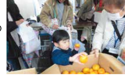
11月 三世代交流会事業・みかんのつかみ取り