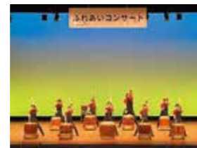
12月 中丸ふれあいコンサート