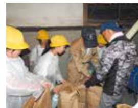
10月 もみ袋詰め体験