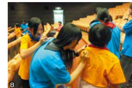
写真：1. 班のみんなで協力したウォークラリー、ゴールも全員で！ 2. ご飯は残さず食べられたかな。3. キャンプファイヤーは神秘的で素敵でした。4. 宿泊棟ではみんなで UNO をしたり、話をしたりしました。5. ウォークラリー表彰式。中学生リーダーが企画しました。6. 班別自由行動では、小学生と事前研修で考えた行程通り活動できました。7. 野菜は小さめに切ると火の通りが早いかな？ 8. 「楽しかったよ！また来年も一緒にいこうね！」到着後、文化センターでお互いのTシャツに思い出を書き合っただよ。