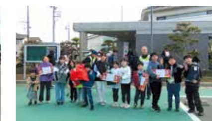
12月 お楽しみウォークラリー大会