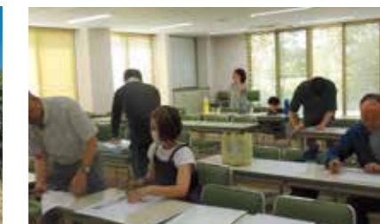
8月 ペットボトルロケットを作って飛ばそう! 準備