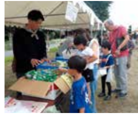
10月 世代間ふれあい事業 【しらかた交遊会まつり】