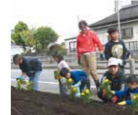
6月 石神地域ふれあい花壇整備