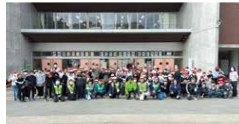
11月 環境美化花植え