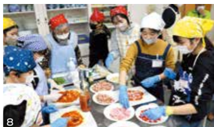
写真：1. 暑い中、水鉄砲で大はしゃぎ。子どもも大人も全力で楽しみました。2. 交流館の広場で流しそうめん。いろいろなものが流れてきたよ。3. 村松虚空蔵尊で座禅体験。静かな時が流れました。4. 村松地区散策。学芸員の方から、地区の歴史についてお話を聞きました。5. 西山研修所の館内オリエンテーリング。こんなところに、こんな文字が！ 6. 夕食のバーベキューの準備。野菜もたくさん食べよう！ 7. 企画会議を行い、みんなでピザの具材を決めました。8. 生地をこねるのは大変だったけど、トッピングは楽しいね。