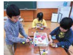
1月 まゆ玉つくり会