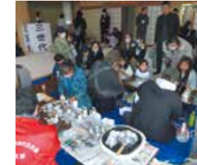
11月 三世代交流会事業・ オリジナルクラフト体験