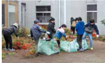
10月 白方小美化作業