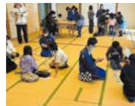
12月 今昔いちりん祭