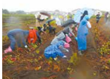
10月 わいわい芋掘りまつり