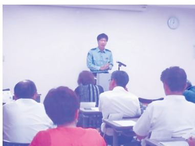
▲東海地区交番所長講話