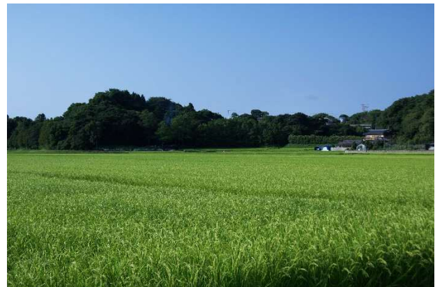
東海十二景「細浦青畝」