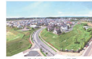
住宅地と周辺の風景

住まいの選択肢が豊富！ 都会と比べて地価が 安いので、マイホーム の夢が叶えやすい！ インフラ整備も充実しており、下水道普及率 は県内第3位と上位にランクインしています。 出典：国土交通省 令和6年度末の汚水処理人口普及状況について