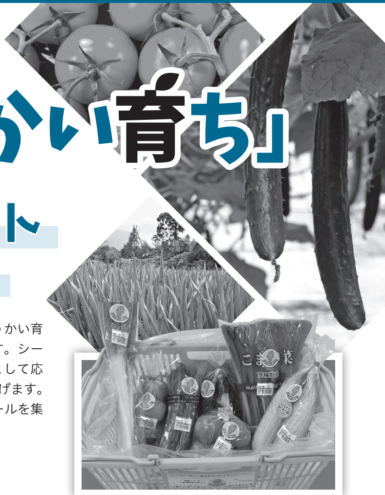
▲イモゾーのシールを貼ったマイバスケットに入れた農産物を差し上げます