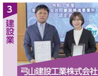
弓山建設工業株式会社

女性でも着用しやすい作業服や防寒着へリニューアルしました。今後は男女別に「快適トイレ(洗面台・鏡・荷物置き等を備えた使いやすいトイレ)」を設置する予定です。