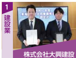
株式会社大興建設

【問い合わせ】村民活動支援課村民活動支援担当(☎282-1711 内線1462)