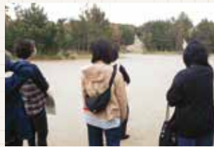
東海村歴史ツアー

「ハーモニ―東海」は、 東海村をゆる〜く 学びながら自分の視野を 広げられる場所です