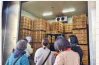
ほしいも工場見学