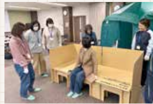
災害時の対応を学ぶ