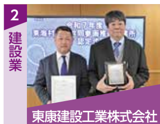
東康建設工業株式会社

子連れ出勤や子どもと一緒に参加できる食事会の開催など、少人数ならではのアットホームな雰囲気の中で、皆が協力して働きやすい環境づくりに取り組んでいます。