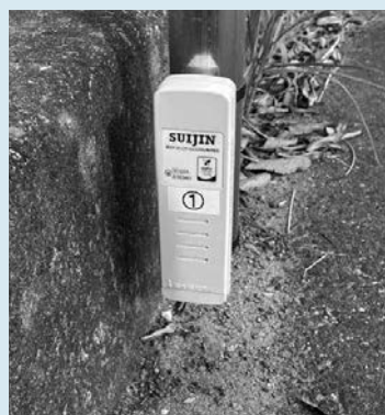
▲村内に設置してあるワンコイン浸水センサ