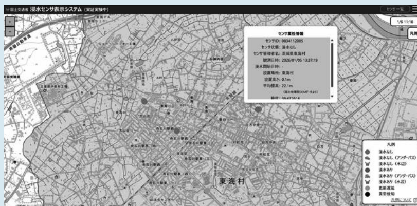
▲浸水センサ表示システム