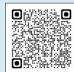
▲浸水センサ表示システム