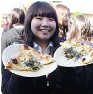
#できたてピザ #しあわせ