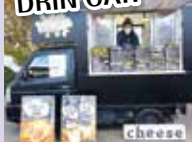
トルティーヤ&ドリンク