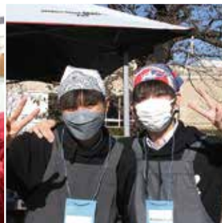
#キッチンカー #接客