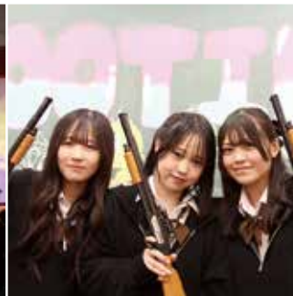
#いつもの教室が模擬店に