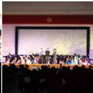
#全クラスがステージ発表