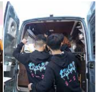
#おそろい #クラストレナー