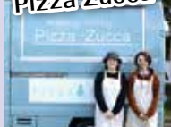
本格薪窯ピッツア