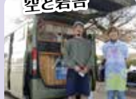
ヴィーガンスイーツ