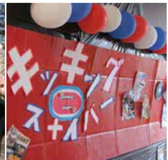
#放課後 #みんなで手作り