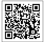
▲救急車利用マニュアル