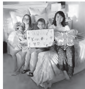
ホストファミリーと過ごす ファミリーデー