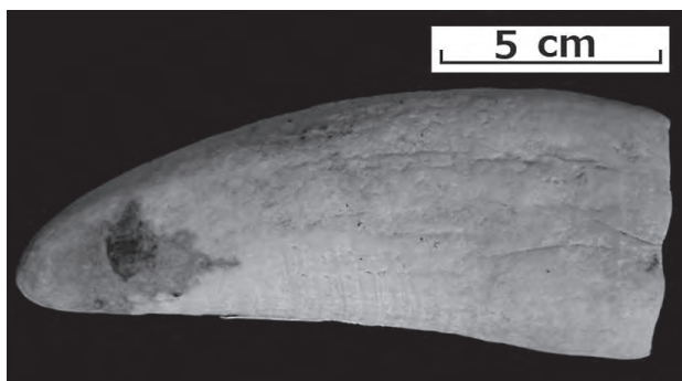
【マッコウクジラの歯】

東海村でのマッコウクジラ漂着記録は、豊岡海岸での子どもの個体だけのようです。よって、このマッコウクジラの歯は東海村で最初の貴重な記録といえます。一本の歯だけが発見された理由は、沖合で死んで海底に沈んだクジラから歯が抜け落ち、平成23(2011)年に発生した巨大地震の津波で、海底にあった歯が打ち寄せられたためと考えられます。そして、その中の一