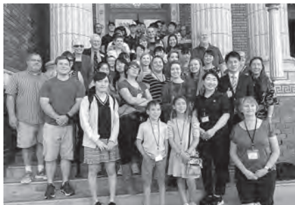
アイダホフォールズ市役所を表敬訪問