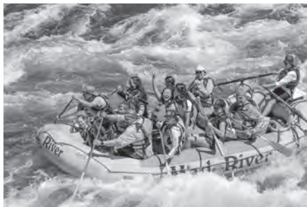
大自然を満喫! みんなでボートに乗って川下り