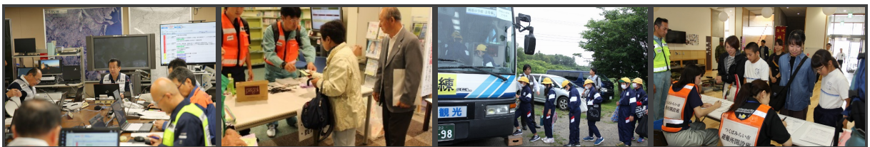
①災害対策本部の運営 ②一時集合場所の受付 ③小学校児童の避難 ④児童の保護者引渡し