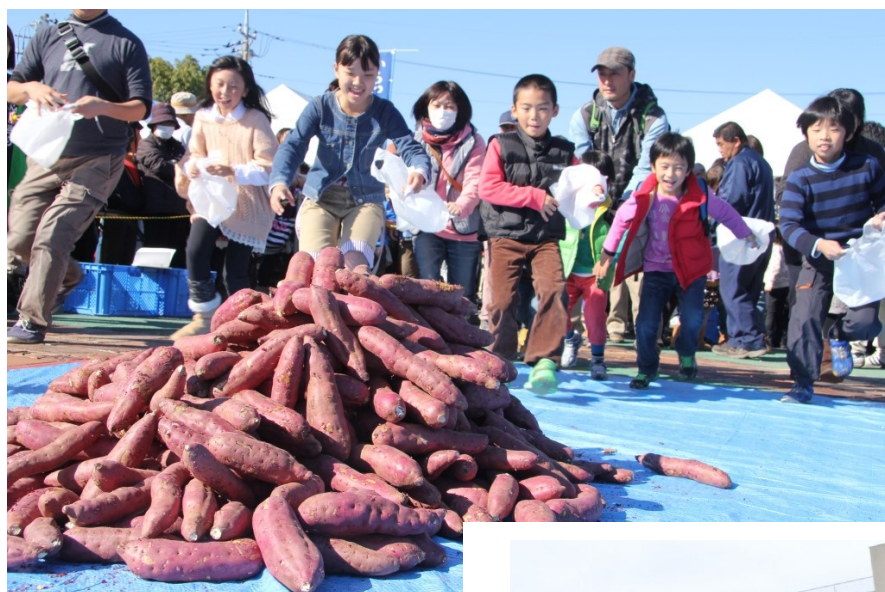
〈今までの開催の様子〉

日 時：令和4年11月23日（水） 午前10時から午後2時00分まで ※荒天中止 場 所：東海文化センター周辺