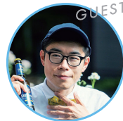
カメラマン 佐野匠さん