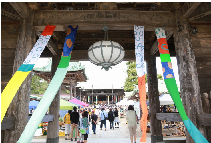
〈今までの開催の様子〉