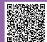
イモゾーリレー 特設HP

「イモゾーリレー」は、東海村スポーツ推進委員協議会が開発した、本村の特産品である「ほしいも」をテーマにしたリレー形式のオリジナルニュースポーツです。お友達や職場の同僚、ご家族などで、是非ご参加ください!!